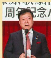
櫻田義孝文部科学副大臣