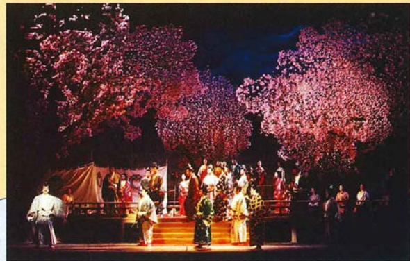
1988年3月 東京文化会館

「袈裟と盛遠」は、文化庁により明治百年記念として石井歆に委嘱、1969年に初演された名作です。氏は大柄で明朗闊達、くつたくなのお人柄で、当財団の理事も務められ、私も公私にわたりご交誼ご指導をいただきました。何ものにも気兼ねすることなく自由な語法、骨組の確かスケールの大きいこのオペラは、歌手にとって共感・理解しやすく朗々と歌いあげられます。今回がシリーズ七演となりますが、1988年の三演(演出：栗園安彦、指揮：星出豊)は文化庁派遣として、ポロランド・ワルシャワ音楽祭に、文化交流・日本オペラ団体初のヨーロッパ公演として参加しました。テアトル・ウエルキでの五日間にわたる公演は、いずれも満席。初日終演後劇場主催のプレミアパーティには、多数の政府高官も来場され、ヤルゼルスキー首相夫人のご挨拶等、誠に温かい歓待を得ました。新聞も「異国趣味でなく、真の偉大な芸術、真の日本的定形を示す」と極めて好意的に論評されました。関係者の方達との交流の場での話題も、常にこのオペラと、日本の伝統とのかかわりでした。また自国の文化に対する誇りと愛着の深さに感銘を受け、日本オペラ創造の意義をあらためて自覚させられたものです。この平家物語によるドラマは、源頼朝に平家追討の決意をせまる等、歴史の裏面で暗躍した怪僧、文覚上人の出家への発心起縁物語です。上人の若き姿遠藤盛遠は直情径行。親友の渡辺ノ渡の美しい妻袈裟御前に横恋慕。あやまつて袈裟を殺めるという惨劇に、盛遠の驚愕・改悟。平安時代は女性優位、自らの意思で自らの命運を定め、従容として死を迎える袈裟の誇り高き真情に心うたれ、ものあわれを感じます。キャストは近年の日本オペラのステージを、確かな演奏で支えていただいている方達と、オーディションにより新人の起用を求めます。指揮の柴田真郁、演出の三浦安浩は、共に次代のオペラ界を担う期待の気鋭です。この名作のさらなる評価の高まりを託しています。