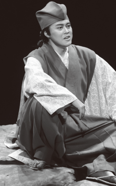
日本オペラ協会公演